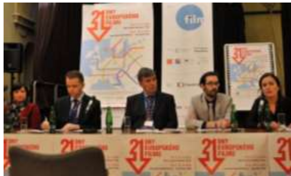
Tisková konference DEF

Dny evropského filmu mohou nabízet kvalitní program jen díky podpoře těchto institucí, organizací a osob: