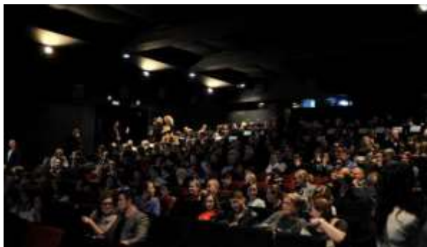
Plný sál kina Světozor

Na řadu snímků byly kinosály zcela vyprodány. V předprodeji bylo prodáno více než 3 000 vstupenek. Celková návštěvnost byla přes 14 000 diváků.